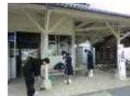
佐津駅清掃活動の様子

～各種研究授業・研究会、弁論大会、中間テスト等々、「学問の秋」に取り組みます。～