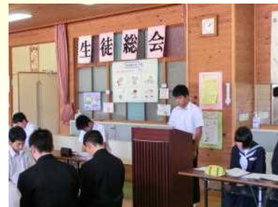
～ 後期活動方針の説明の様子 ～ 生徒全員が真剣に協議しました ～